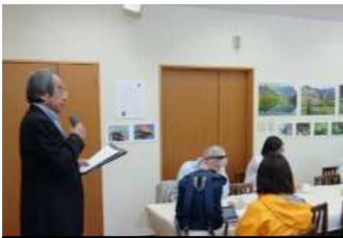
上高地の取組みを説明する上條町会長