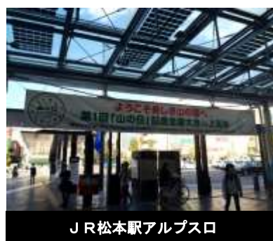
JR松本駅アルプスロ