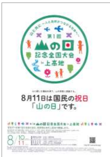
【先行版】5月～（5/20現在の協賛者を紹介）