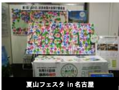
夏山フェスタ in 名古屋