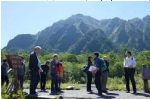
晴天下での上高地散策