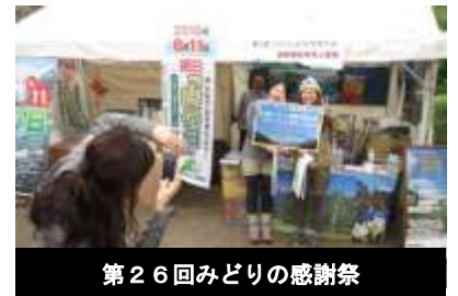
第26回みどりの感謝祭