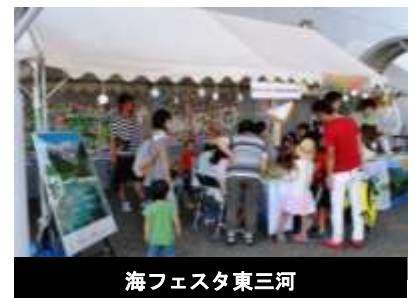
海フェスタ東三河