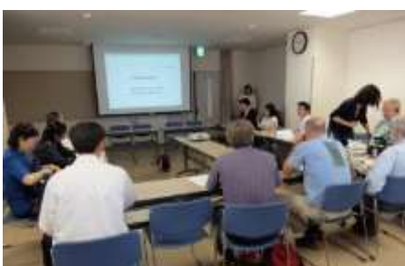
ヤマレコの遭難対策モデル事業のプレゼン