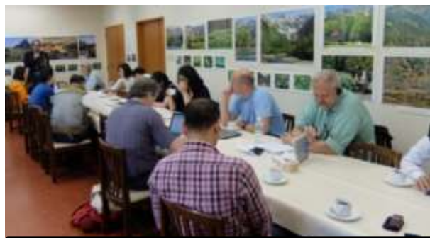
町会長の説明を聴講する記者