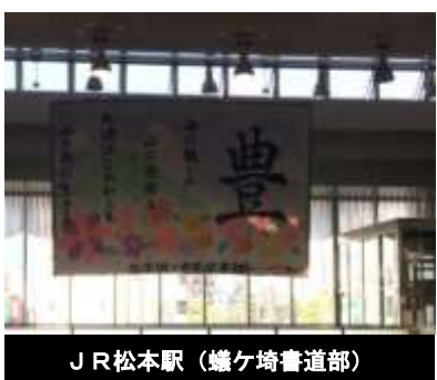
JR松本駅(嬬ヶ埼書道部)