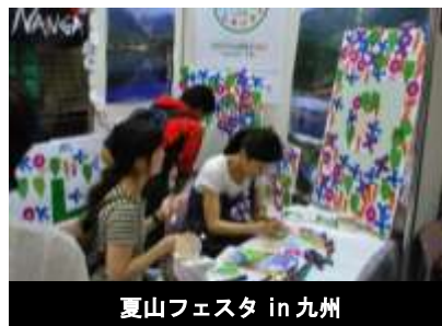
夏山フェスタ in 九州