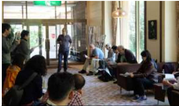
事務局長の説明を聴講する記者