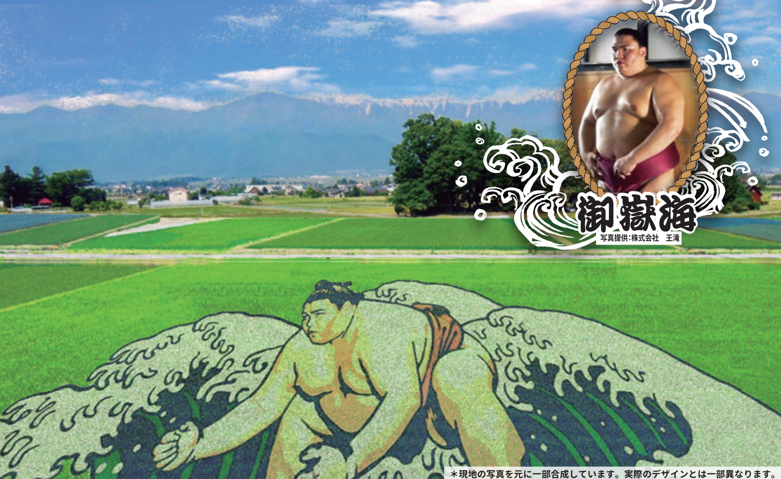
*現地地の写真を元に一部合成しています。実際のデザインとは一部異なります。