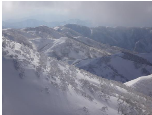
この三王子の斜面はガスの時いつも手古摺る。 対岸が少しガスが上がって来た。