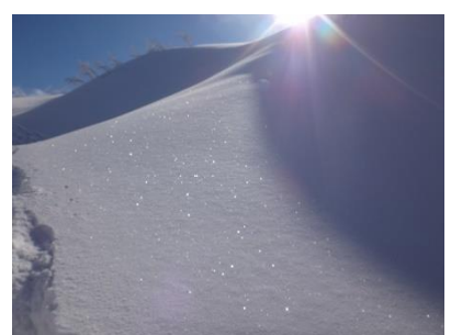
雪面の美しさ、優美さは ”たおやかな二王子岳” かもしれない！