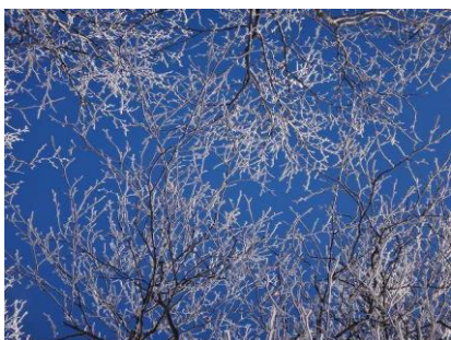
綺麗な見送りに感謝しつつ下山する。