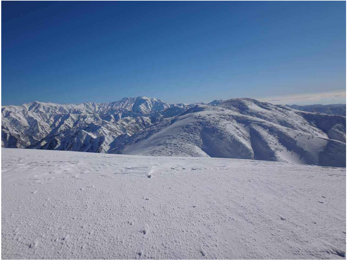
中央の奥に大日岳が、左に北股岳が。 目の前の稜線を辿れば門内岳へ行ける。