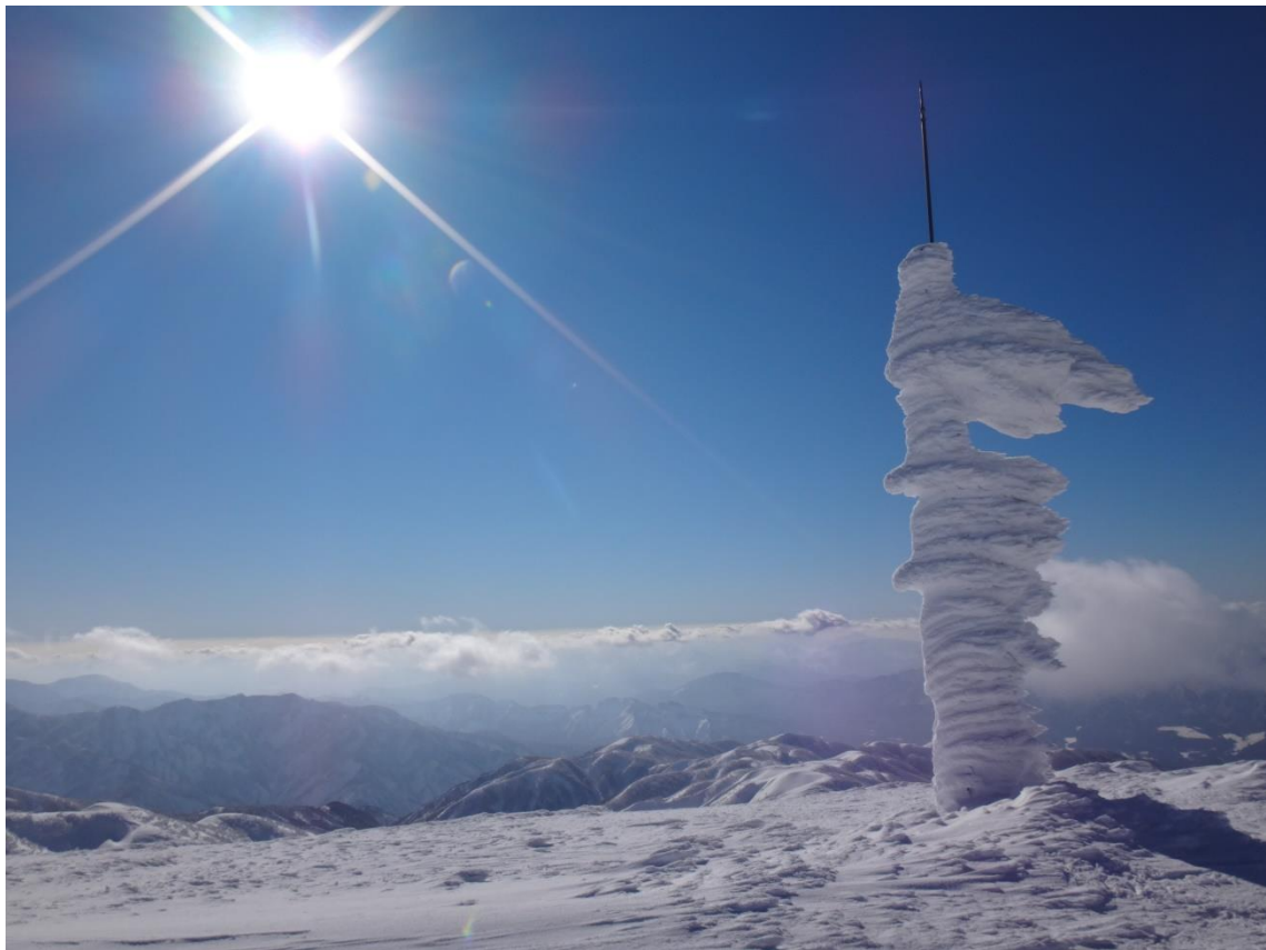
山頂端のアンテナより下山に掛かる。