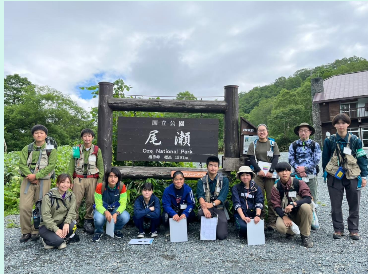
群馬県立尾瀬高校で開催