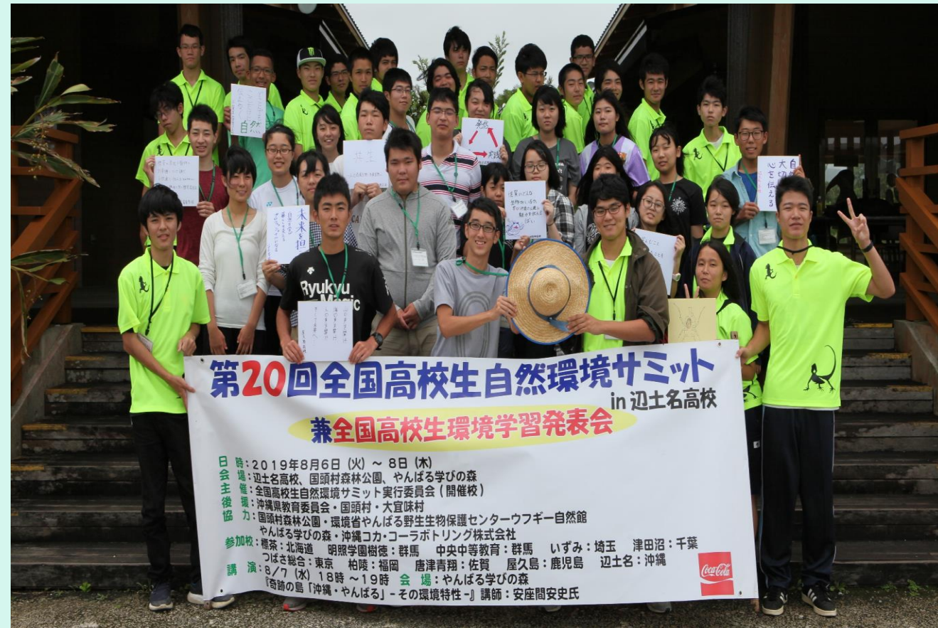
2019年 辺土名高校で開催